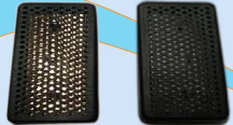
2 Platten à 80mm x 40mm x 13mm

Aufgrund der Wirkungsweise, zersetzen sich die Metalle und dienen im Aquarium als zusätzlicher natürlicher Dünger, der das Wachstum der Pflanzen positiv beeinflusst. Die Wirkungsdauer beträgt mind. 2 Jahre!