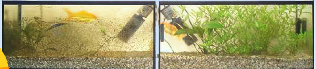
Linke Bildhälfte ohne Aqua Stabil